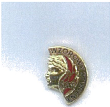
Oznaka Odznaki złotej