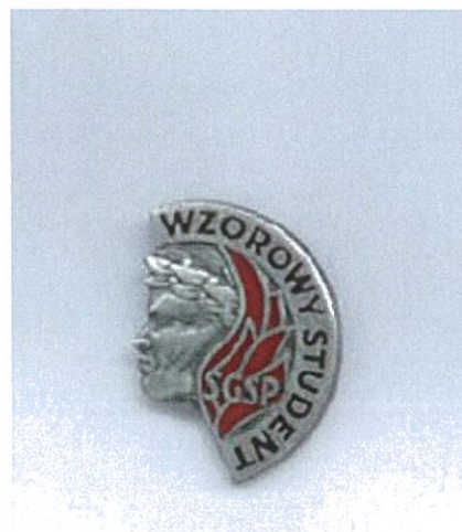
Oznaka Odznaki srebrnej