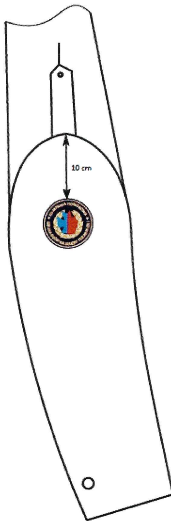
Rys. 2. Sposób noszenia emblematu Kompanii Honorowej SGSP