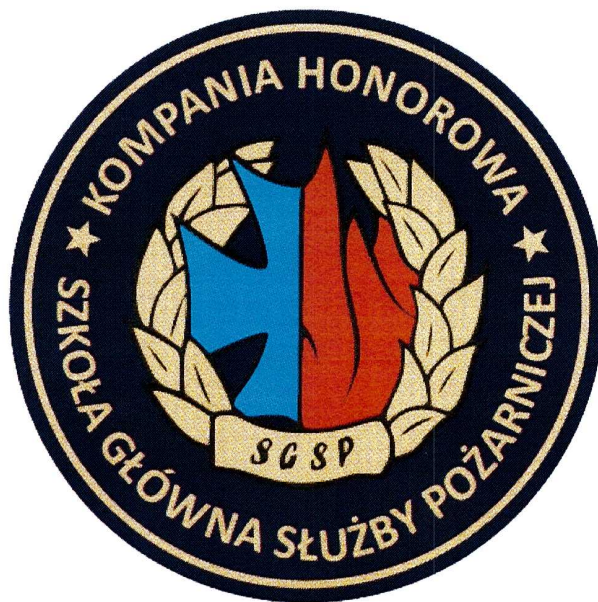
Rys. 1. Emblemat Kompanii Honorowej SGSP